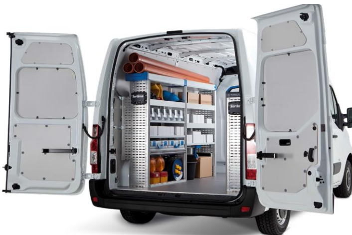
XBGR = Sortimo Globelyst hyllyjärjestelmä Suositushinta 2 430 € + autovero