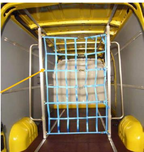
XBDI = Siirrettävä verkkoväliseinä Suositushinta 960 € + autovero