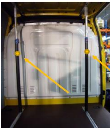
XBDT = Teleskooppi kiinnitystangot Suositushinta 180 € + autovero